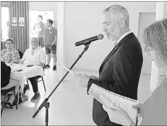
Der französische Politiker und Bürgermeister des Partnerortes Fabien Gouttefarde hält eine beeindruckende Rede.