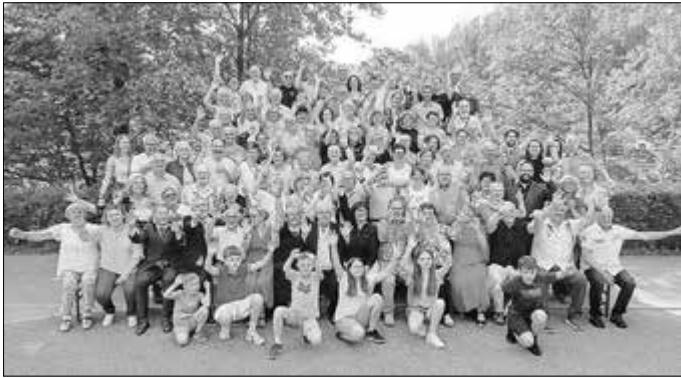
Zum Abschluss des Treffens gab es ein gemeinsames Foto der Wendehäuser mit den Gästen aus Frankreich.

Freundeskreises im Thüringer Landtag für die Unterstützung des jetzigen Treffens. Laut Urbach gibt es momentan 49 derartige Partnerschaften zwischen Thüringen und Frankreich. Der Freundschaftsvertrag zwischen den Städten Mühlhausen und Tourcoing bestehe sogar schon seit 1961.