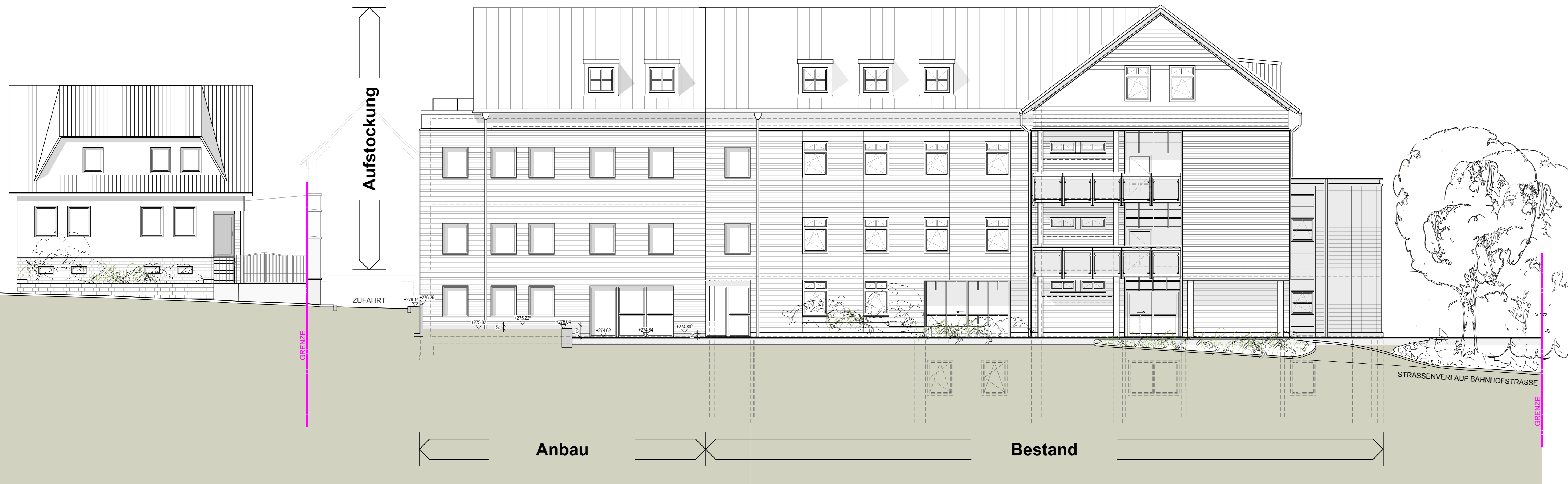
Ansicht von Süden

STIFTUNG ST. JOHANN NEPOMUK ST. ELISABETH KRANKENHAUS LENGENFELD/STEIN