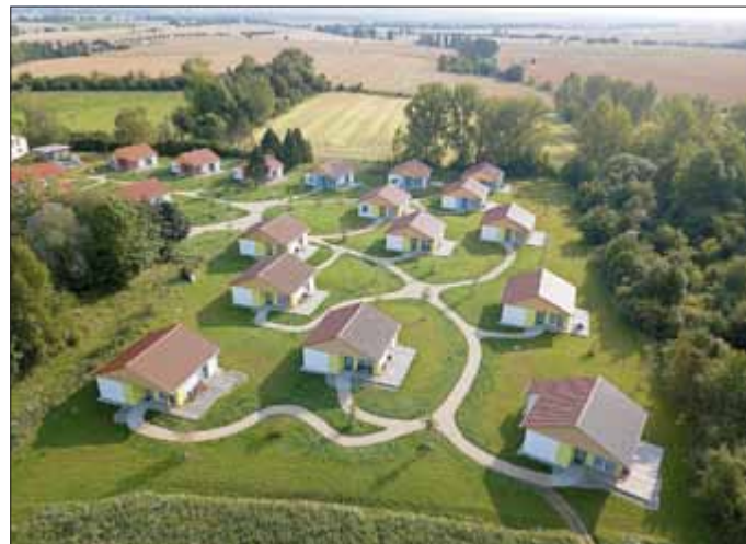
Insgesamt zählen 26 Ferienhäuser zum Ferienpark.