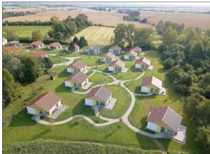
Insgesamt zählen 26 Ferienhäuser zum Ferienpark.