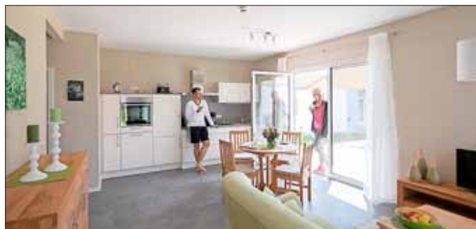
Ein Blick ins Innere der Ferienhäuser zeigt, wie liebevoll diese ausgestattet sind.